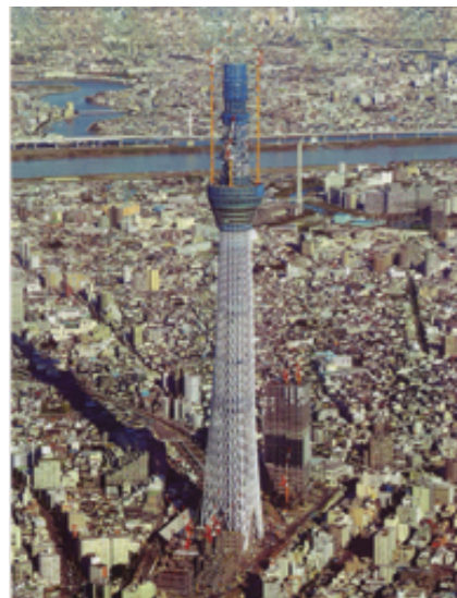
■建設中の東京スカイツリーの航空写真(2010年11月3日撮影)

財団法人 日本文化用品安全試験所 ホームページ: http://www.mgsl.or.jp/