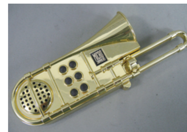
音の出る玩具の例