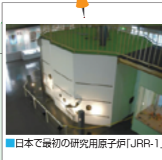
■日本で最初の研究用原子炉「JRR-1」

見学を行い、原子という目に見えない物質の存在の重さに改めて気付くと共に、「原子力とはなんだろう」と考えさせられる研修会となりました。(M.O)