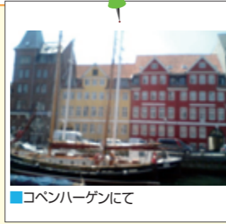
■コペンハーゲンにて

最後に、今年一年が皆様方にとってよい一年でありますことを心より願っています。(K.K)