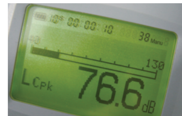
騒音計によるC特性ピーク音圧レベルの指示値